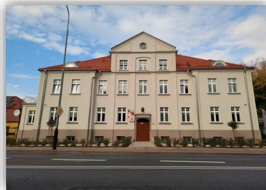
Budynek Bursy przy ul. Słowackiego

Z dniem 1 września 2020 r. zgodnie z uchwałami Rady Powiatu Wrzesińskiego nr 117/XVII/2020 oraz nr 118/XVII/2020 z dnia 31 marca 2020 r. Bursa Międzyszkolna we Wrześni stała się samodzielną placówką oświatową z siedzibą przy ul. Słowackiego 11 oraz dodatkową lokalizacją prowadzenia zajęć opiekuńczo-wychowawczych przy ul. Kaliskiej 2a. 1 grudnia 2023 r. do użytku została oddana trzecia lokalizacja w Grzymysławicach.