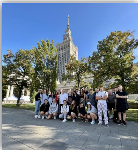
Warszawa – wycieczka ZSTiO

W wycieczkach wzięli udział uczniowie Liceum Ogólnokształcącego oraz Zespołu Szkół Technicznych i Ogólnokształcących.