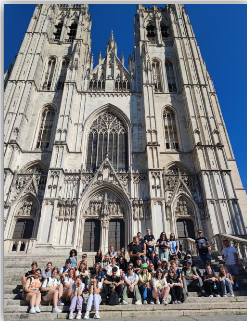
Katedra św. Michała i św. Guduli w Brukseli