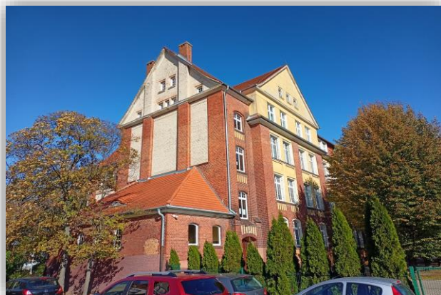
Budynek ZSZ nr 2

Zespół Szkół Zawodowych nr 2 zlokalizowany jest przy ulicy Koszarowej 12 w obiektach opuszczonych przez Armię Radziecką. Powstał 1 września 1993 roku poprzez wydzielenie z ówczesnego Zespołu Szkół Zawodowych przy ulicy Wojska Polskiego oddziałów, w których prowadzone było kształcenie pracowników młodocianych.