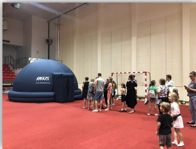
Pokaz w mobilnym planetarium

planetarium i wsłuchiwały się w prelekcję pt. „150 milionów kilometrów kosmicznej podróży”, z której dowiedziały się, jak Słońce wpływa na planety układu słonecznego. Nie zapomniano też o miłośnikach sztuki – dla nich przygotowano pokaz tańca w wykonaniu tancerzy z Alchemia Dance Studio oraz występ uczniów Powiatowej Szkoły Muzycznej I stopnia we Wrześni.