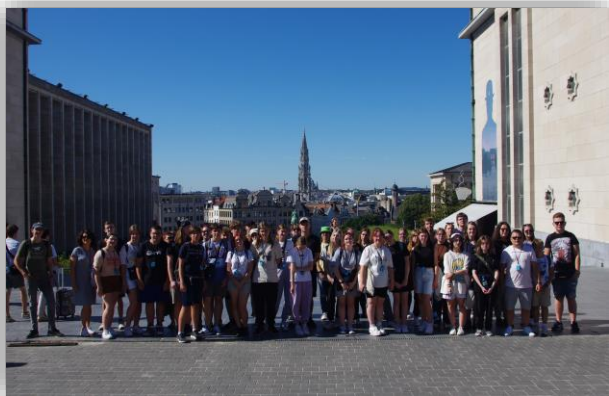
Bruksela - wycieczka ZSP

Czterdziestu uczniów pod opieką nauczycieli z Zespołu Szkół Politechnicznych we Wrześni wyjechało w dniach 6-8 września 2023 r. na wycieczkę do Belgii i Holandii, zwiedzili tam m. in. Parlament Europejski, Katedrę Świętego Michała i Świętej Guduli oraz Polski Honorowy Cmentarz Wojskowy w Bredzie.