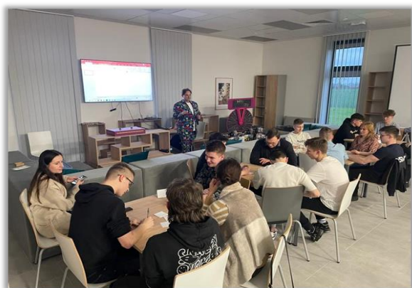
Quiz BrainOn – noc logistyków