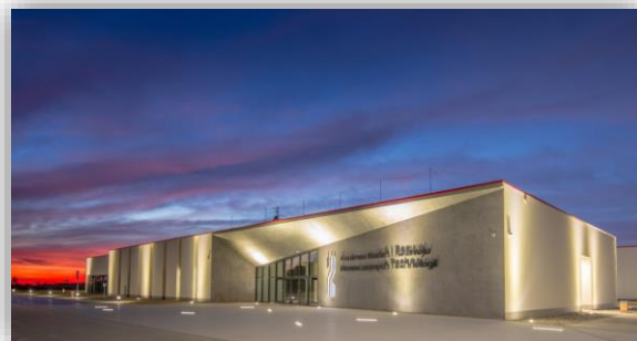
Centrum Badań i Rozwoju Nowoczesnych Technologii

Szczegółowe informacje o zadaniach realizowanych przez placówkę zawiera rozdział VI. Kształcenie zawodowe (str. 23-27).