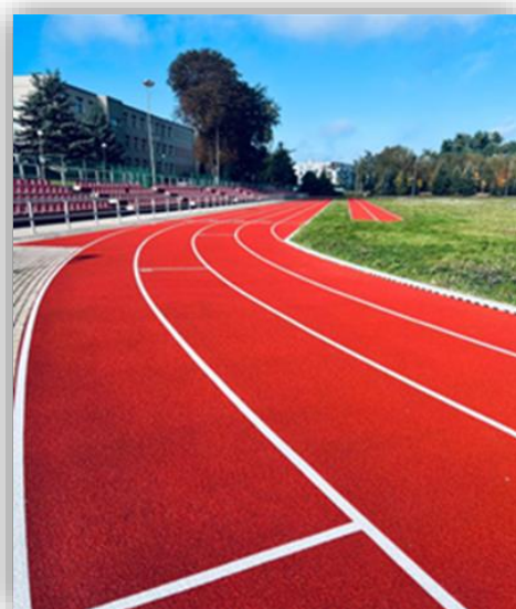
Stadion lekkoatletyczny przy ZSTiO