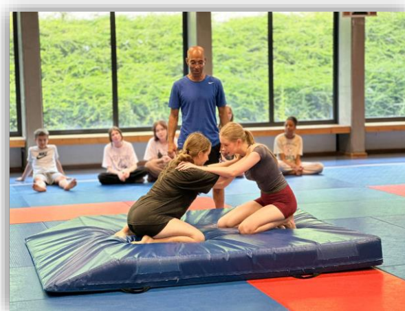
Zajęcia z judo