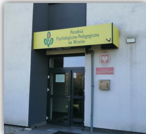
Wejście do PP-P

Szczegółowe dane merytoryczne i statystyczne o pracy Poradni Psychologiczno-Pedagogicznej zawiera punkt 1 rozdziału VII. Kształcenie specjalne (str. 28-36).