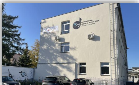
Budynek PSM I st.

Ogółem w Powiatowej Szkole Muzycznej kształciło się 124 uczniów.