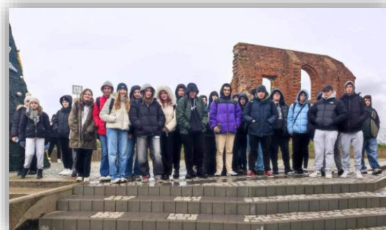
Ruiny kościoła w Trzęsaczu

Młodzież z Zespołu Szkół Technicznych i Ogólnokształcących uczestniczyła w „Zielonej szkole” w Dźwirzynie, podczas której realizowała projekt edukacyjny pn. „Z historią i kulturą Pomorza za pan brat”. Uczniowie Zespołu Szkół Zawodowych nr 2 podążali szlakiem zamków gotyckich oraz odkrywali architektoniczne tajemnice Dolnego Śląska,