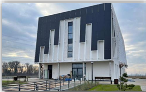
Budynek Bursy w Grzmysławicach