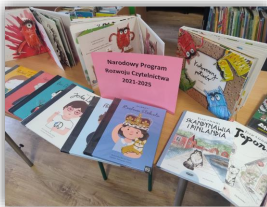
Wystawa książek w ZSS

Narodowy Program Rozwoju Czytelnictwa 2.0 jest programem uchwalonym na lata 2021-2025 przez Radę Ministrów w celu poprawy stanu czytelnictwa w Polsce poprzez wzmacnianie roli bibliotek publicznych, szkolnych i pedagogicznych jako lokalnych ośrodków życia społecznego, stanowiących centrum dostępu do kultury i wiedzy. W Powiecie Wrzesińskim dotacje na rok 2023 pozyskano dla Szkoły Podstawowej Specjalnej nr 4 w Zespole Szkół Specjalnych we Wrześni w kwocie 4 000,00 zł. Dofinansowanie zostało wykorzystane na zakup książek oraz audiobooków. Szkoła w ramach projektu podejmowała również działania promujące czytelnictwo, takie jak obchody Dnia Głośnego Czytania, Konkurs z okazji Święta Biblioteki Szkolnej – „Kwiatek dla biblioteki z przesłaniem”, spotkania autorskie oraz wiele innych.