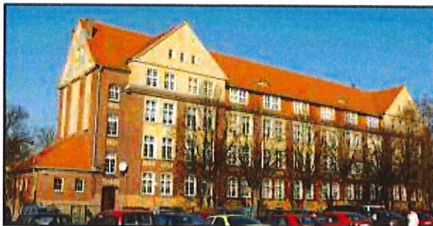
Września: Blok żołnierski w zespole koszar wojskowych (1) obecnie Zespół Szkół Zawodowych nr 2 im. Powstańców Wielkopolskich

Obiekt w strefie ochrony konserwatorskiej historycznego układu urbanistycznego miasta. Budynek powstał w 1910 r. jako blok żołnierski. Obiekt monumentalny, na rzucie litery E, dwupiętrowy, kryty wysokim dachem namiotowym. Cechuje go surowość, prostota i oszczędność w detale architektoniczne.