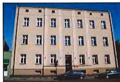
Września: Dawny Ośrodek Zdrowia przy ul. 3 Maja

Obiekt w strefie ochrony konserwatorskiej historycznego układu urbanistycznego miasta. Kamienica z początku XX w. Pierwotnie jako budynek piętrowy kryty dachem namiotowym. W l. 30. XX w. nadbudowano drugie piętro. Po II wojnie światowej pełnił rolę ośrodka zdrowia.