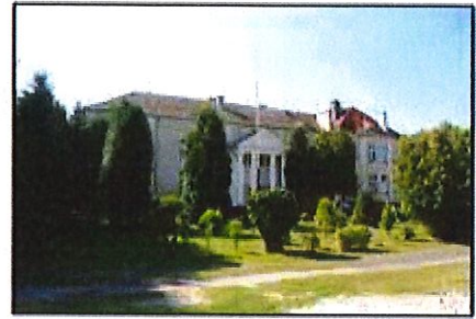
Zieliniec: Park krajobrazowy