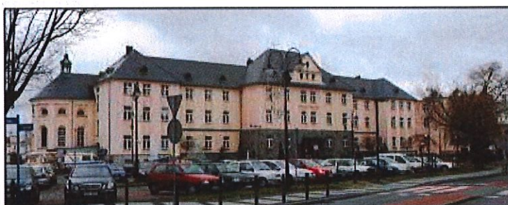
Września: Stary budynek Szpitala Powiatowego

Obiekt w strefie ochrony konserwatorskiej historycznego układu urbanistycznego miasta. Budynek wzniesiony w l. 1925-1929 wg projektu Józefa Gierczyka. Jest to budynek wieloczołowy (skrzydło główne, do niego przylegające prostopadle skrzydła boczne, skrzydło zbudowane na podstawie starego budynku szpitalnego oraz kaplica zamknięta półkoliście), na wysokim podpiwniczeniu, dwupiętrowy, kryty wysokim dachem wielopołaciowym krytym łupkiem, na dachu kaplicy wieżyczka. Elewacja frontowa osiemnastoosiowa z ryzalitem centralnym i dwoma bocznymi.