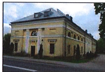
Kołaczkowo: Dawna stajnia dworska

Budynek z poł. XIX w. wchodzący w skład zespołu parkowo-palacowego. Obiekt o formach klasycystycznych nakryty dachem naczółkowym. Elewacje rozczłonkowane pilastrami ujmującymi osie okienne: prostokątne na parterze, półkoliste na piętrze. Wejścia w szczytach ujęte przyściennymi kolumnami