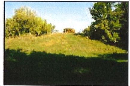
Zieliniec: Grodzisko