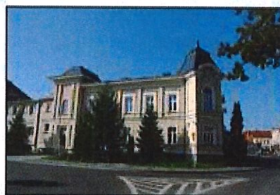
Września: Starostwo Powiatowe

Obiekt w strefie ochrony konserwatorskiej historycznego układu urbanistycznego miasta. Nie znamy dokładnej daty powstania budynku starostwa. Nastąpiło to prawdopodobnie w latach 60. XIX w. W 1912-1913 r. budynek landratury przebudowano ze środków przeznaczonych wcześniej na budowę we Wrześni nowego szpitala. Obok budynku władz powiatowych w 1913-1914 r. pobudowano willę dla starosty powiatowego (dziś budynek gminy, m.in. USC). Główne wejście do starostwa znajdowało się od ul. Ewangelickiej (3 Maja). Obok wejścia umiejscowiono balkon z czterema jońskimi kolumnami zwieńczony trójkątnym tympanonem. Ściany ubogacone były licznymi boniami, gzymsami i pilastrami. Budynek od ulicy otoczony był metalowym, kutym parkanem z mурowanymi słupkami. W 1939 r. po remoncie budynku zubożono jego wielość form architektonicznych. Zlikwidowano kolumny z tympanonem, uproszczono gzymsy nadokienne i pilastry. Rozebrano parkan otaczający starostwo. W 1962 r. pobudowano łącznik pomiędzy budynkiem starostwa a dawną willą starosty tworząc jeden kompleks budynku urzędu (Chopina 9 i 10).