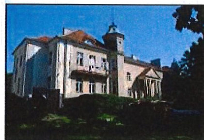
Zieliniec: Pałac

Na terenie parku znajduje się pałac, nie wpisany do rejestru zabytków, zbudowany na pocz. XX w. w stylu eklektycznym. Obecnie piętrowy. Elewację frontową zdobi czterokolumnowy portyk. Jednak bryła budynku została zeszpecona przebudowami.