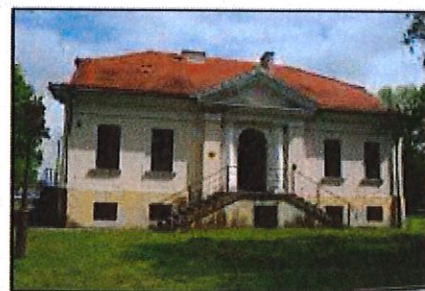
Kołaczkowo: Budynek dworski, czyli oficyna

Budynek z 1820 r. wchodzący w skład zespołu parkowo-palacowego. Budynek o formach klasycystycznych. Parterowy, na wysokim podpiwniczeniu, nakryty dachem naczółkowym. Wejście główne na osi ujęte przyściennymi kolumnami. Nad wejściem trójkątny ryzalit.