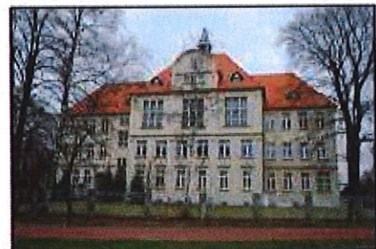
Września: Liceum Ogólnokształcące im. H. Sienkiewicza

Obiekt w strefie ochrony konserwatorskiej historycznego układu urbanistycznego miasta. Budynek zbudowany w 1911 r. wg projektu Paula Pitta z Poznania. Dwupiętrowy budynek na rzucie zbliżonym do litery U, składający się z trzech prostokątnych skrzydeł. Frontowe skrzydło wzbogacone prostokątnym ryzalitem. Budynek nakrywa wysoki dach wielopłociowy, kryty dachówką, na szczycie dachu skrzydła głównego wieżyczka wentylacyjna. Wejścia do budynku od ul. Szkolnej i od ul. Witkowskiej ujęte w portalowe obramienia.