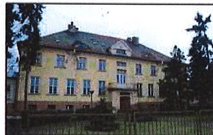
Września: Dawna Szkoła Mleczarska